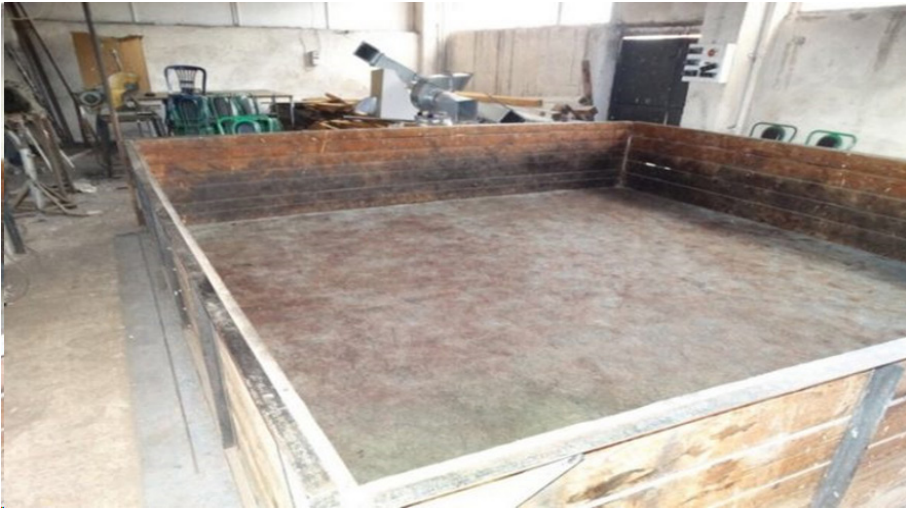
Afbeelding 3 Hondengevecht pit in loods 12

Waar in landen als Servië, Hongarije en Roemenië de pit ook wel in tuinen of weilanden wordt gebouwd om meer toeschouwers aan te kunnen trekken 13 worden pits in Nederland over het algemeen in loodsen of binnenshuis opgezet om geen aandacht te trekken van buitenstaanders.