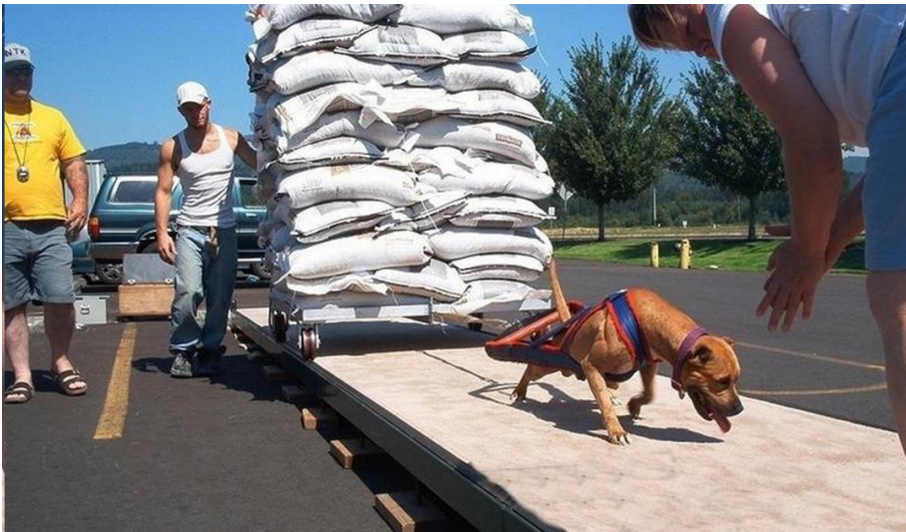
Afbeelding 2 10

Een andere oefening om het uithoudingsvermogen van honden te trainen is hardlopen op een op honden aangepaste loopband. 9 Aangezien sommige trainings-oefeningen verboden zijn in Nederland wijken Nederlandse hondenvechters uit naar buurlanden, zoals België.