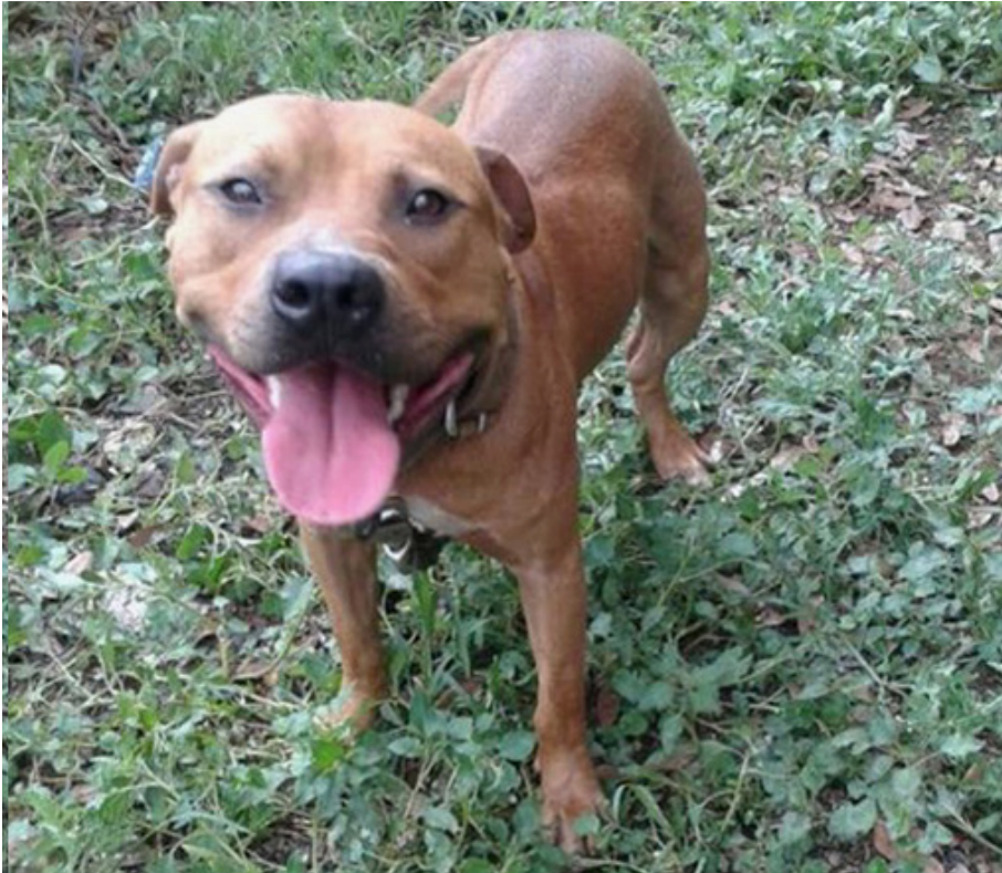
Afbeelding 5: Hondenvechter toont hond aan medehondenvechter 20